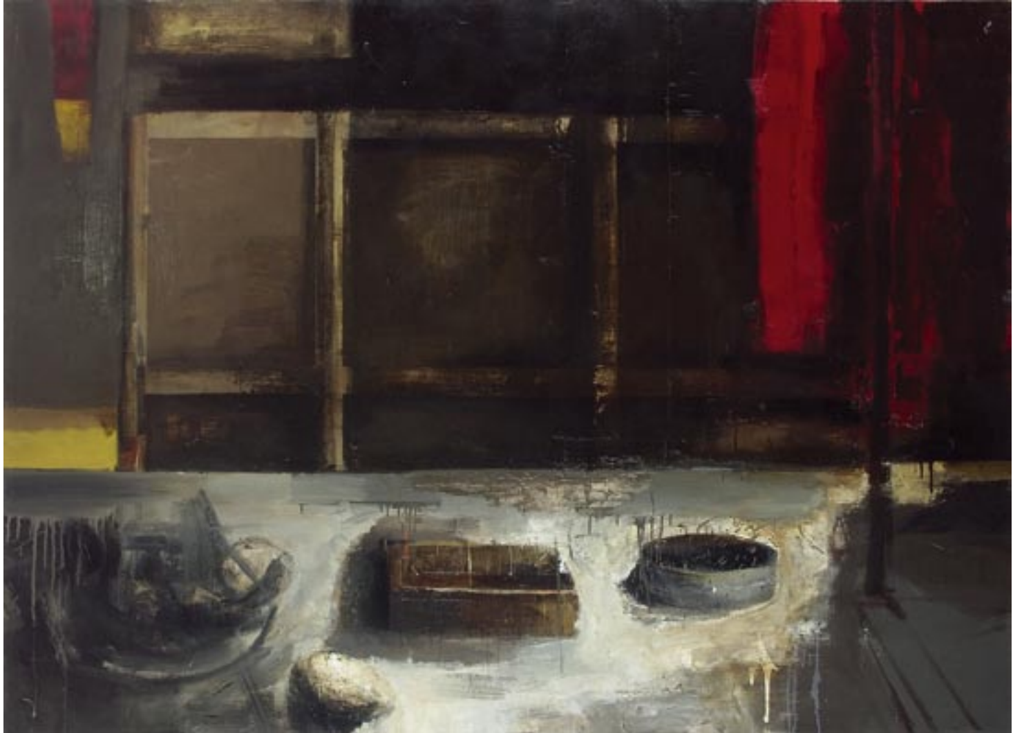
„Obiekty”, 2005 olej na płótnie, w.: 130 x 180 cm / kat. 3