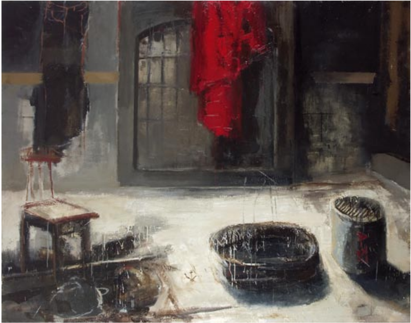
„Pracownia I”, 2004 olej na płótnie, w.: 150 x 190 cm / kat. 1