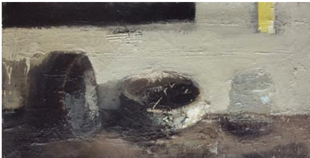
„Martwa natura”, 2005 olej na płótnie, w.: 40 x 80 cm / kat. 21