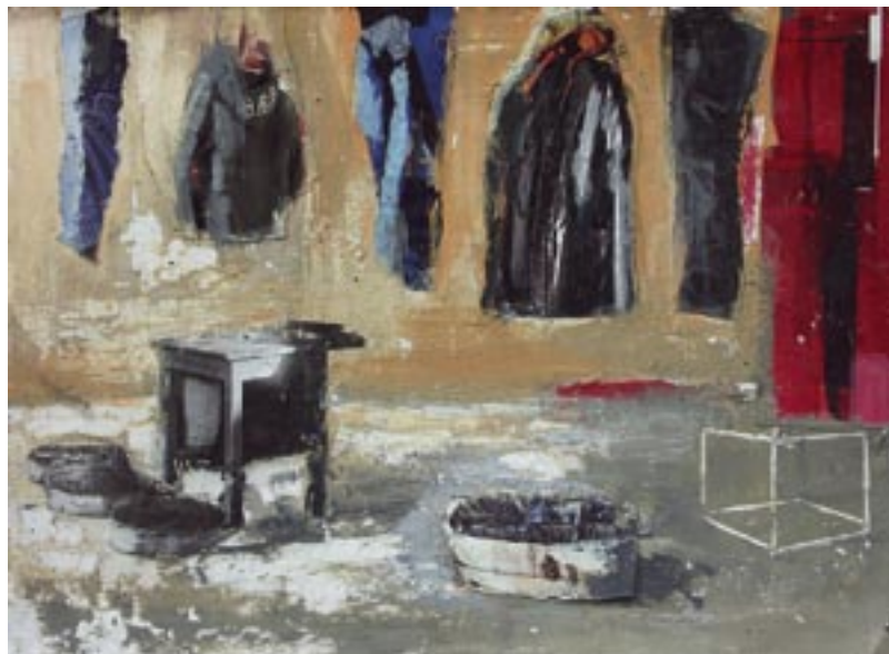
„Kolaż nr 10”, 2004 tech. mieszana, papier, w.: 33 x 45 cm / kat. 33