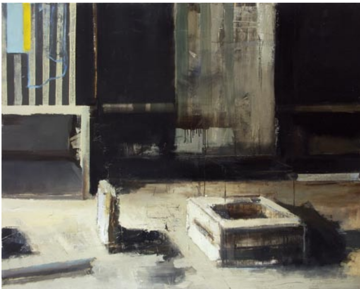
„Studnia”, 2005 olej na płótnie, w.: 120 x 150 cm / kat. 16