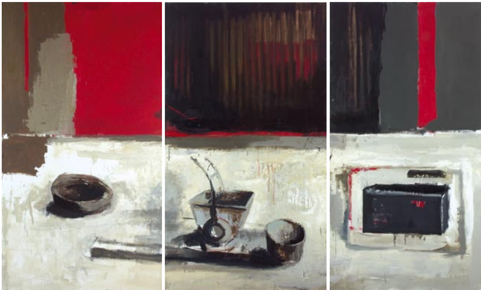
„Na temat światła”, 2004 olej na płótnie, w.: 180 x 300 cm / kat. 19