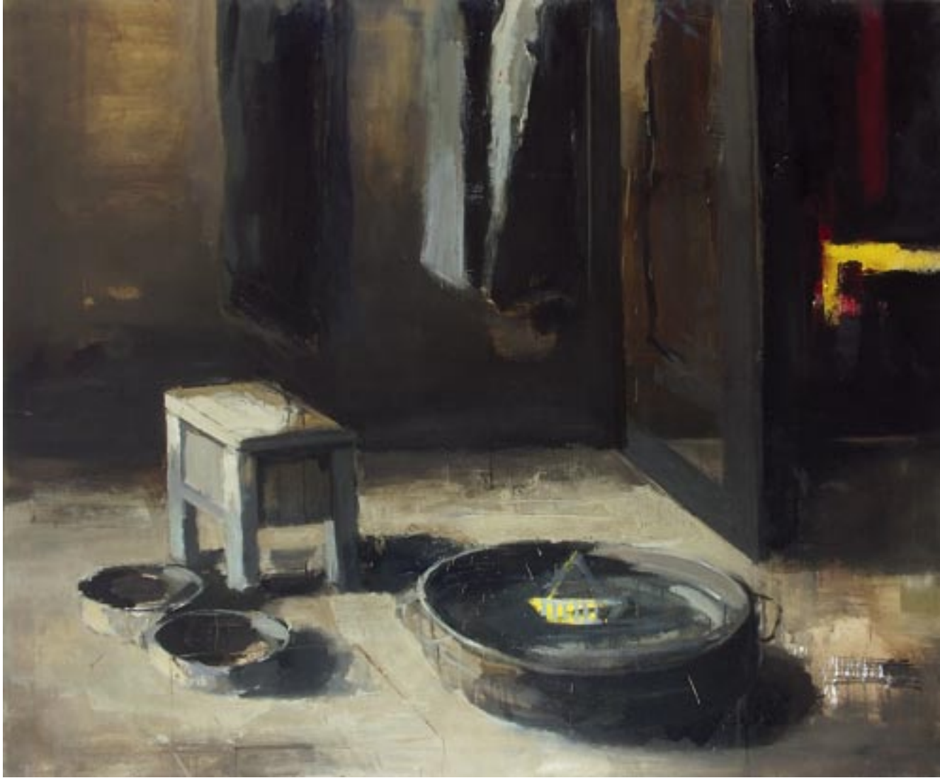
„Pracownia II”, 2004/05 olej na płótnie, w.: 150 x 180 cm / kat. 2