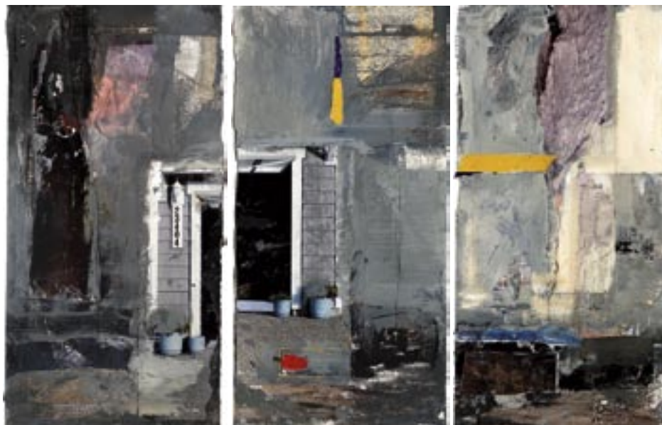
„Trytyk I”, 2004 kolaż, technika mieszana, olej, papier, w.: 33 x 38 cm / kat. 18