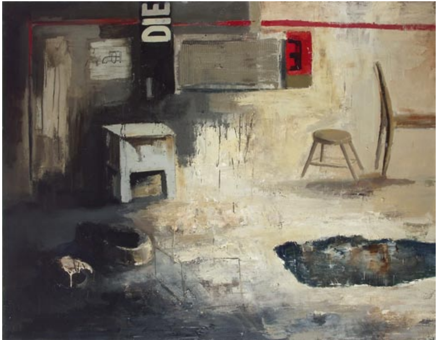
„Przedmioty”, 2004/05 olej na płótnie, w.: 140 x 180 cm / kat. 23