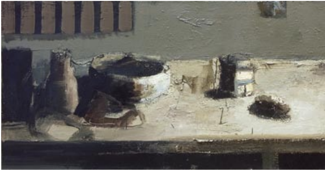
„Martwa natura”, 2005 olej na płótnie, w.: 50 x 100 cm / kat. 20