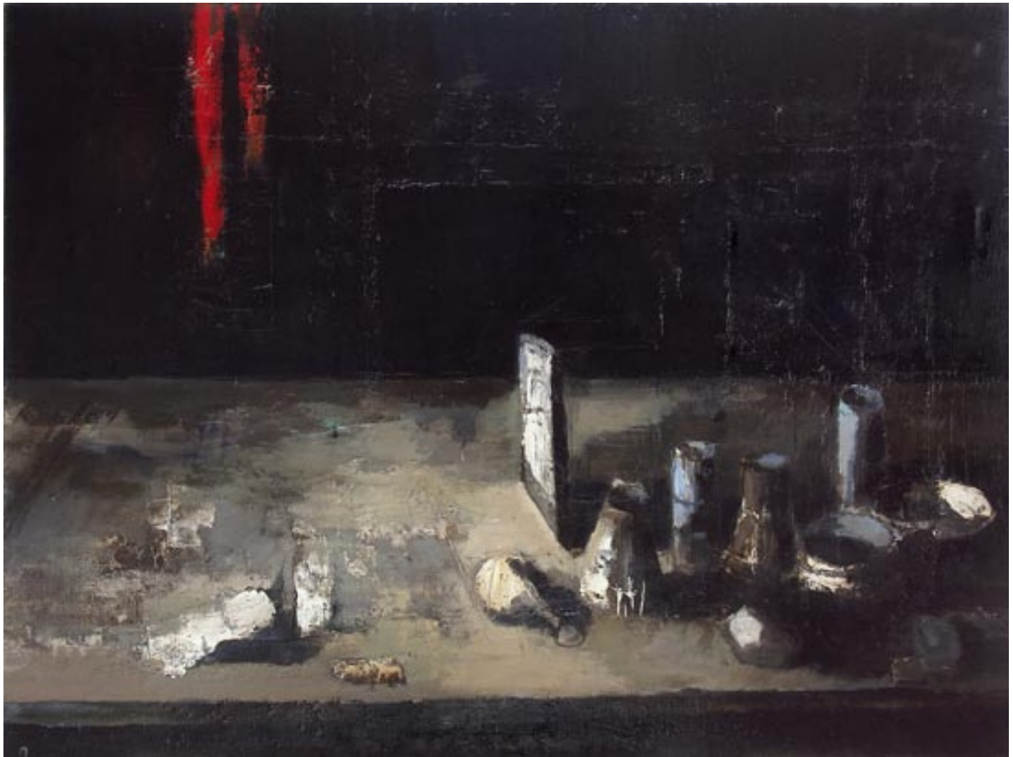
„Martwa natura”, 2004 olej na płótnie, w.: 150 x 200 cm / kat. 5