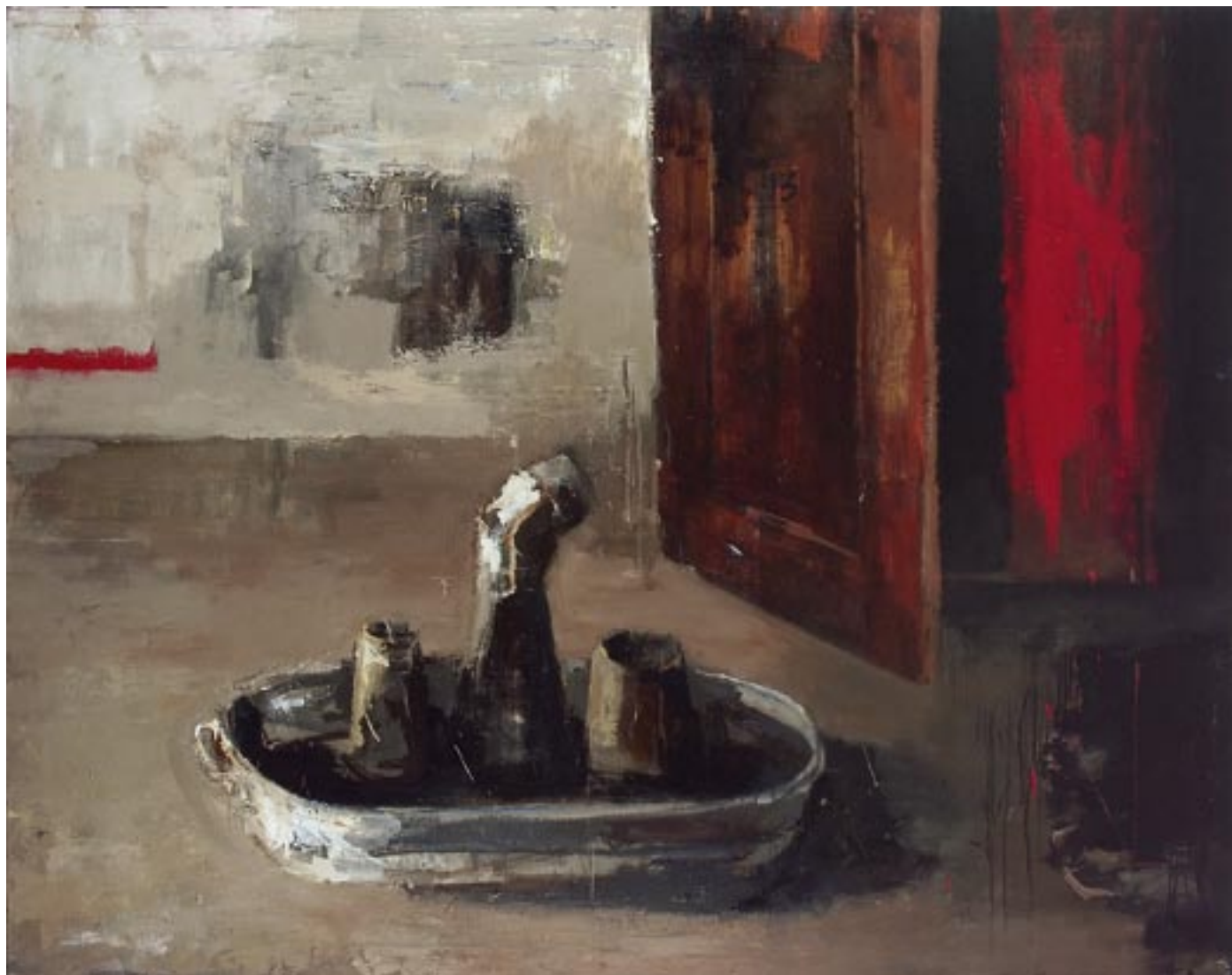
„Wnętrze”, 2004 olej na płótnie, w.: 150 x 190 cm / kat. 22