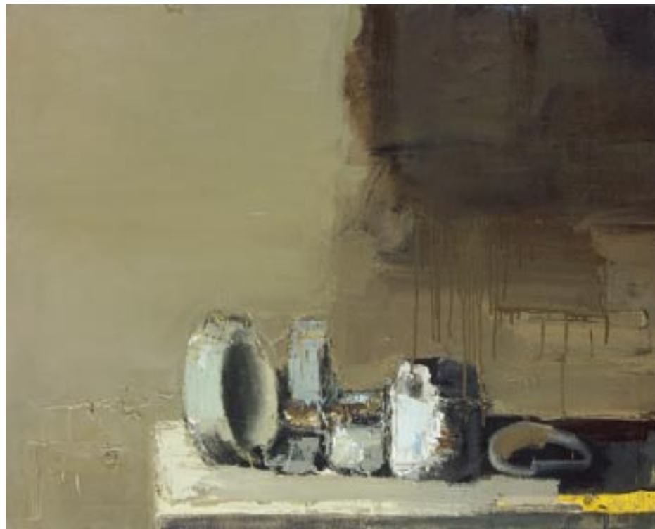
„Martwa natura”, 2005 olej na płótnie, w.: 60 x 80 cm / kat. 4