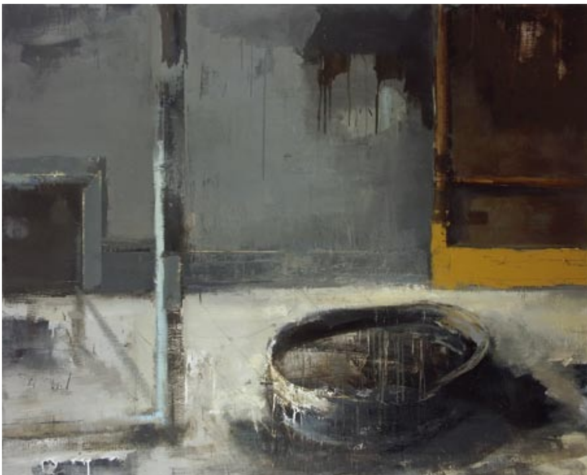
„Wnętrze”, 2005 olej na płótnie, w.: 120 x 150 cm / kat. 17