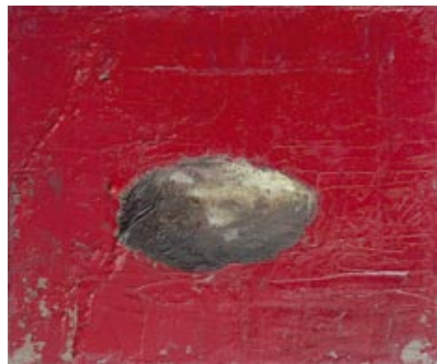
„Przedmiot”, 2005 olej na płótnie, w.: 24 x 33 cm / kat. 9 „Przedmiot”, 2005 olej na płótnie, w.: 25 x 30 cm / kat. 10 „Przedmiot”, 2005 olej na płótnie, w.: 25 x 30 cm / kat. 11