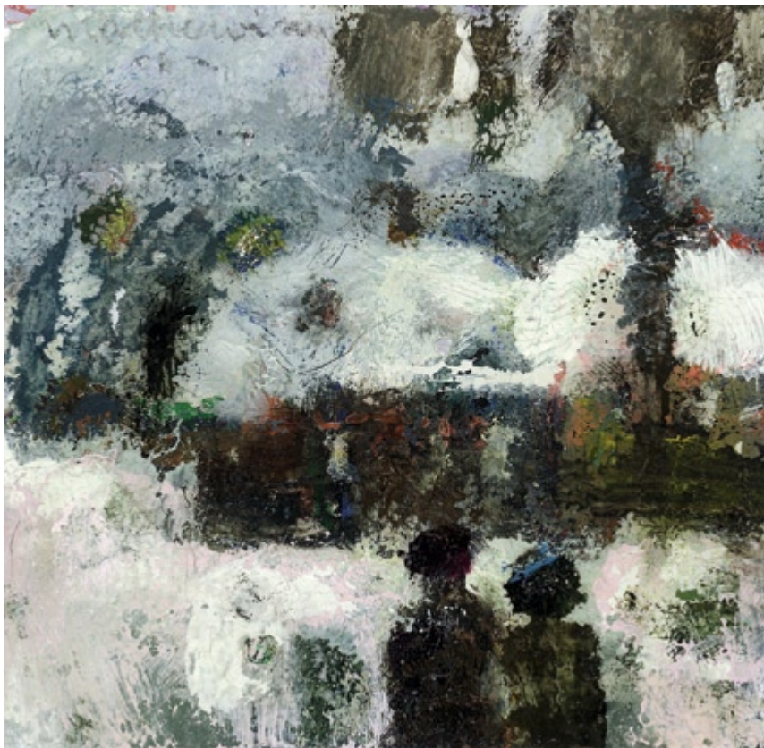
Bez tytułu, 2006 • olej, akryl na kartonie • w.: 9,7 x 10 cm