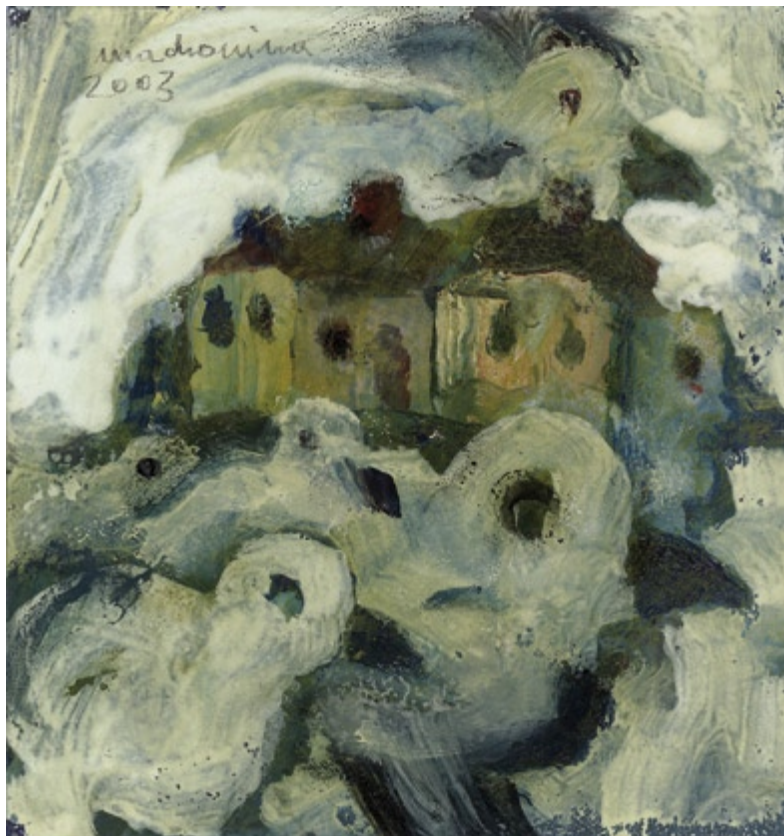
Bez tytułu, 2003 • olej, akryl na kartonie • w.: 16,7 x 15,5 cm