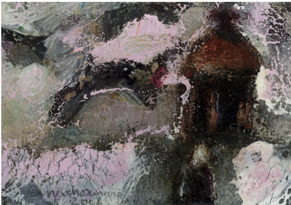
Bez tytułu, 2006 • olej, akryl na kartonie • w.: 7,5 x 10,7 cm

Jest to twórczość na wskroś osobista, intymna, skupiona i zarazem - żarliwa. Operuje przedstawieniami sprowadzonymi do subtelnych i zaskakująco lapidarnych ujęć. Mimo tej syntetyzującej koncentracji form rysunkowych i kolorystycznych, albo właśnie wręcz dzięki nim, Machowina uzyskuje niezwykle efekty. Twórczość Machowiny ma coś z cech właściwych sztuce dziecięcej, z jej bezpośredniością i zaskakującą trafnością obrazowania.