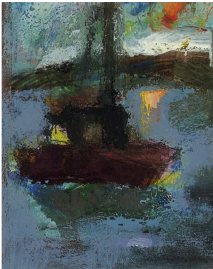
Bez tytułu, 2005 • olej, akryl na kartonie • w.: 13,2 x 10,5 cm