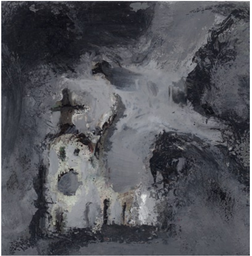
Bez tytułu, 2005 • olej, akryl na kartonie • w.: 15 x 12,5 cm