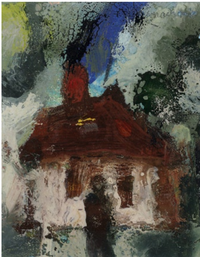
Bez tytułu, 2006 • olej, akryl na kartonie • w.: 13,5 x 10 cm