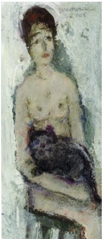
Bez tytułu, 2006 • olej, akryl na kartonie • w.: 21,7 x 9 cm