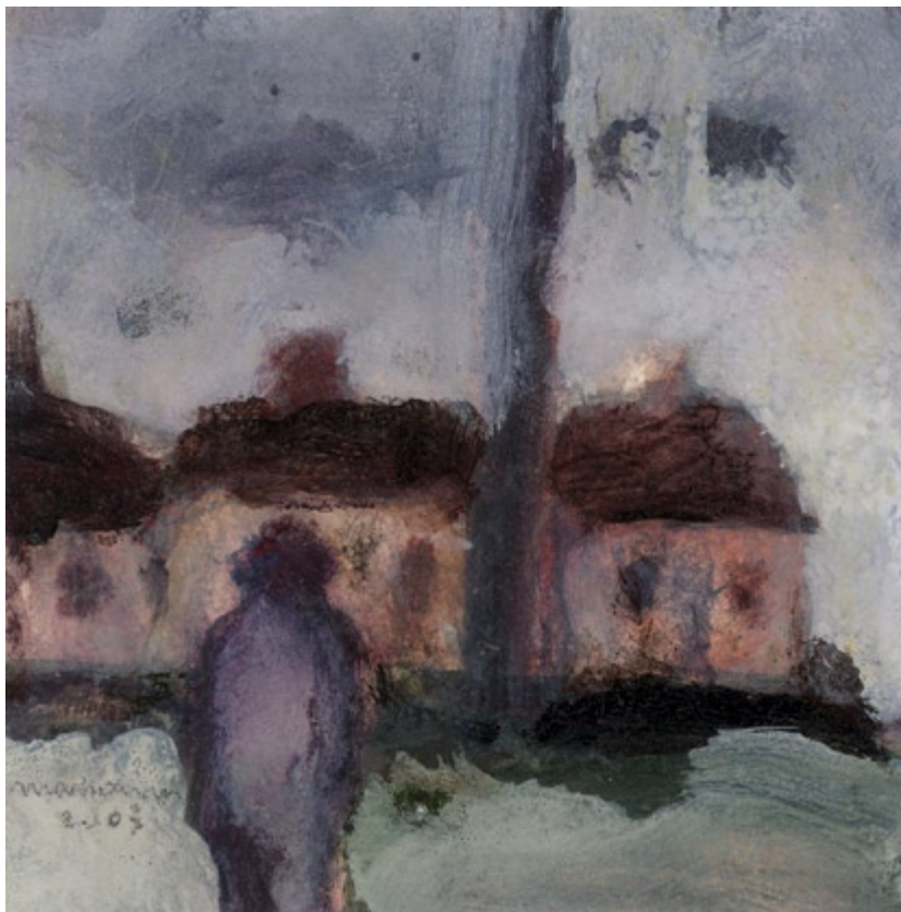
Bez tytułu, 2003 • olej, akryl na kartonie • w.: 13,6 x 13,5 cm