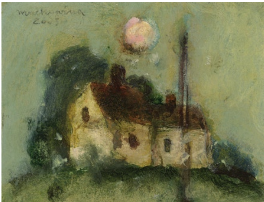
Bez tytułu, 2003 • olej, akryl na kartonie • w.: 11,7 x 14,2 cm

Piękno jako przejaw istnienia i formy jest łącznym i jednoczesnym przejawianiem się wszystkich własności transcendentnych, czyli także prawdy i dobra. Ta wewnętrzna jedność wizji malarskiej uobecnia się w tematach obrazów Machowiny. Chrystus Frasobliwy, portrety kobiet i ich akty, kościoły, ptaki, drzewa i domy, to realia utożsamione w mowie serca z samym artystą. Aby więc usłyszeć tę mowę, nawiązać z nią dialog, trzeba ją zaakceptować poprzez otwarcie się na to, co dla artysty jest naprawdę ważne. Dla Machowiny ważna okazuje się prywatność, niemal familijność takiej rzeczywistości, która choć krucha bo przemijająca, w swojej istocie żywi duszę, umysł i serce.