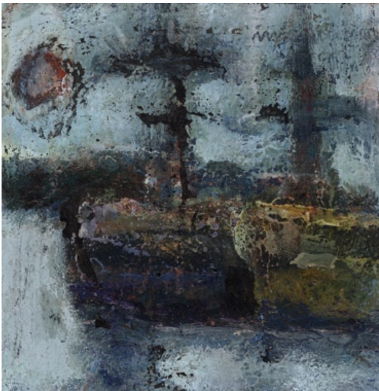
Bez tytułu, 2005 • olej, akryl na kartonie • w.: 12 x 11,5 cm