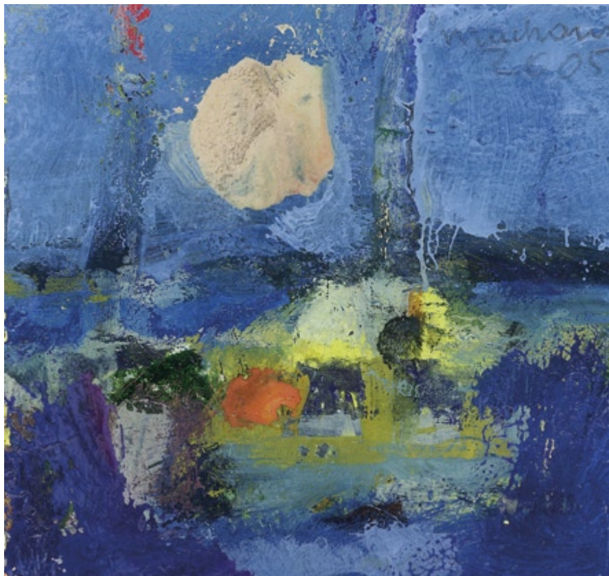
Bez tytułu, 2005 • olej, akryl na kartonie • w.: 10,7 x 11,3 cm