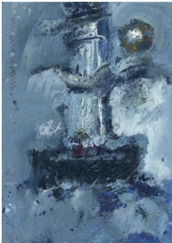
Bez tytułu, 2005 • olej, akryl na kartonie • w.: 12 x 8,5 cm