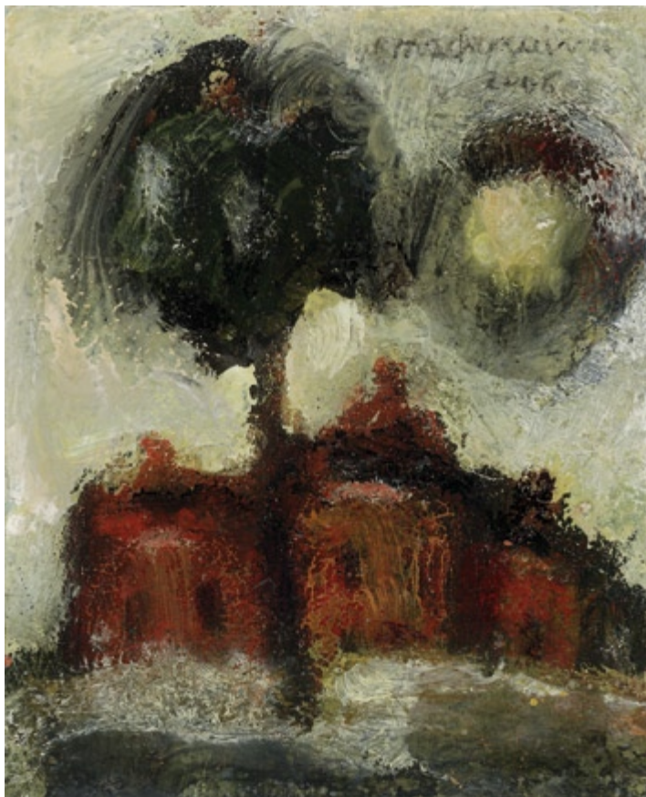
Bez tytułu, 2006 • olej, akryl na kartonie • w.: 13,5 x 11 cm