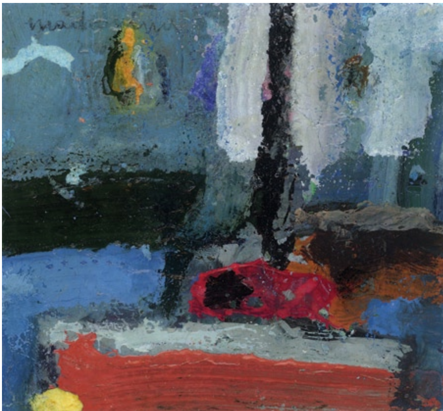
Bez tytułu, 2005 • olej, akryl na kartonie • w.: 10 x 11 cm