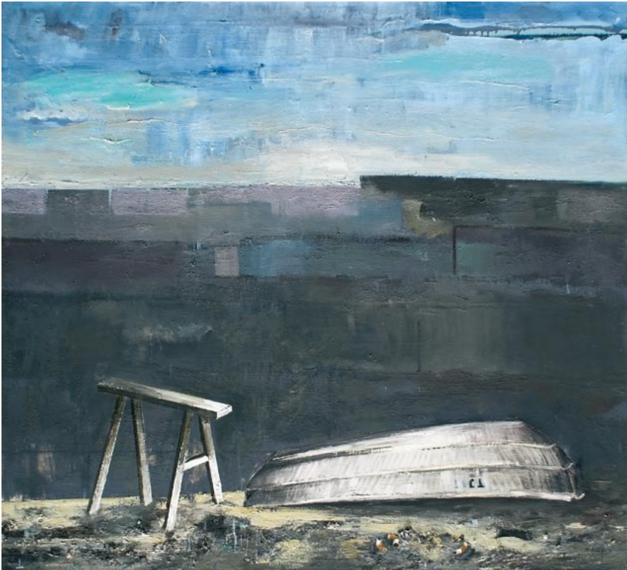
Murter IV (kat. 36)