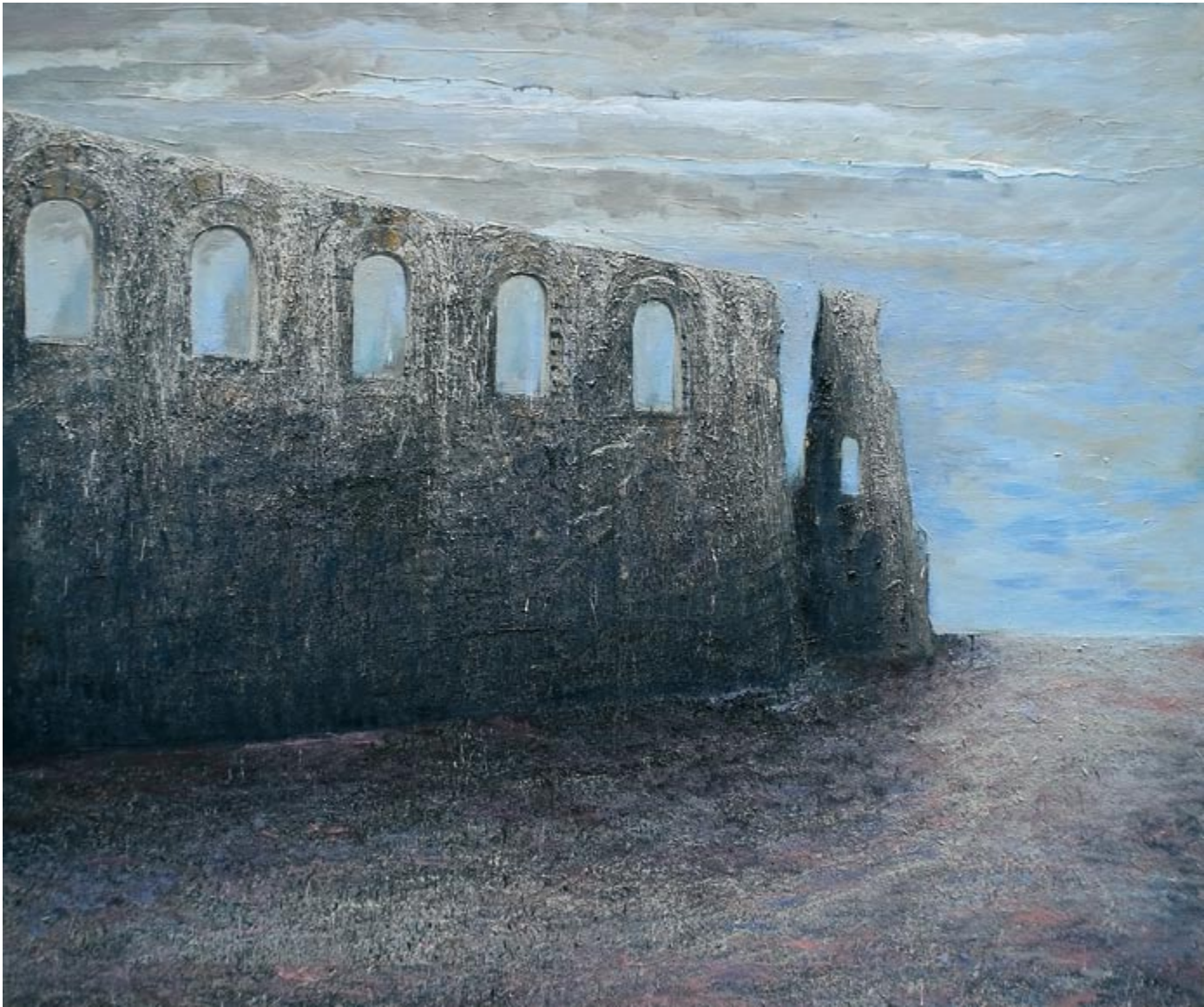
Pałac Dioklecjana I (kat. 35)