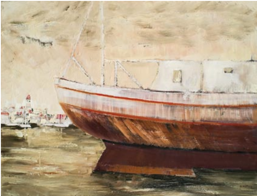
Murter VI (kat. 38)