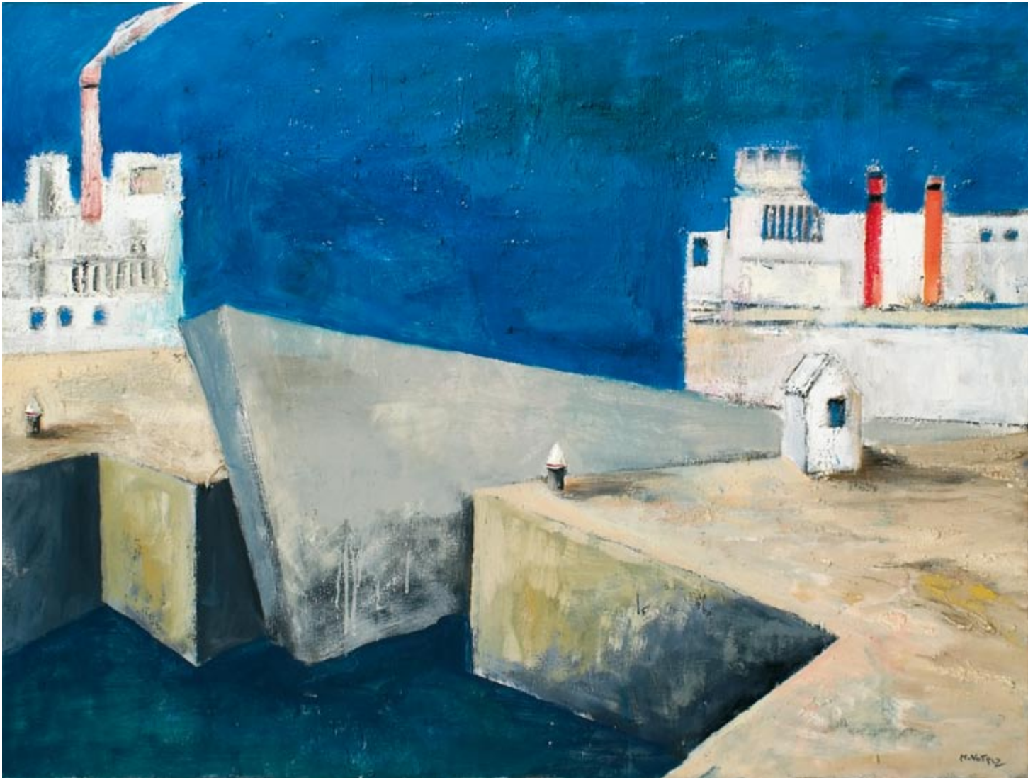
Homage dla Masareela, Split (kat. 40)