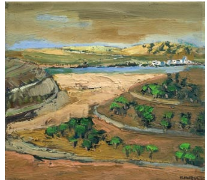
Impresja I (Toskania) (kat. 41)