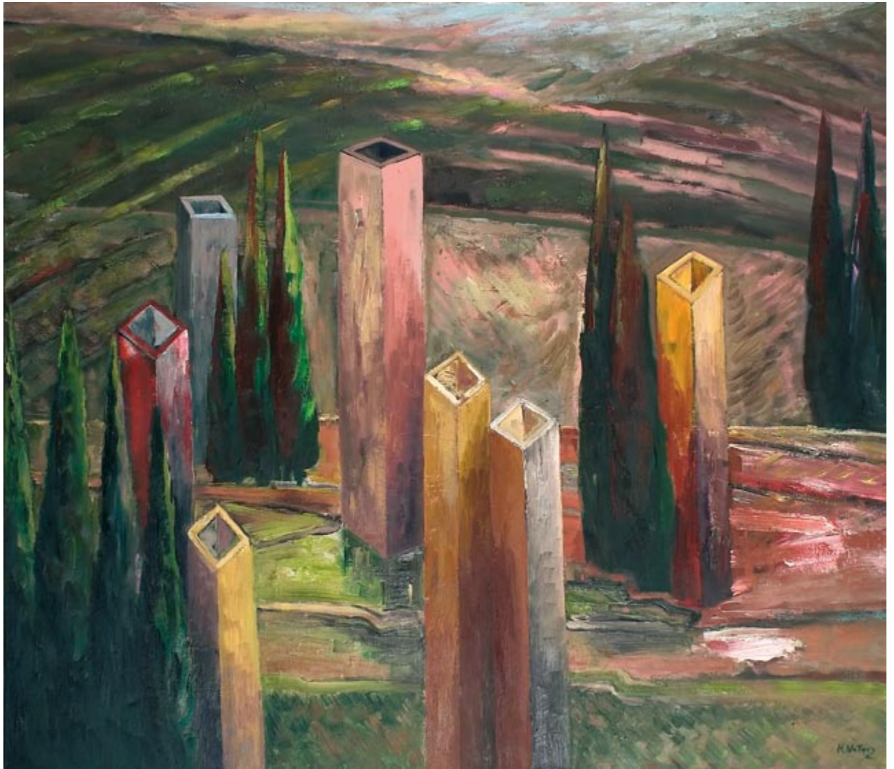
San Gimignano II (kat. 48)