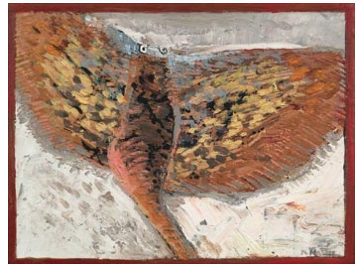
Owoce morza XVI (kat. 31)