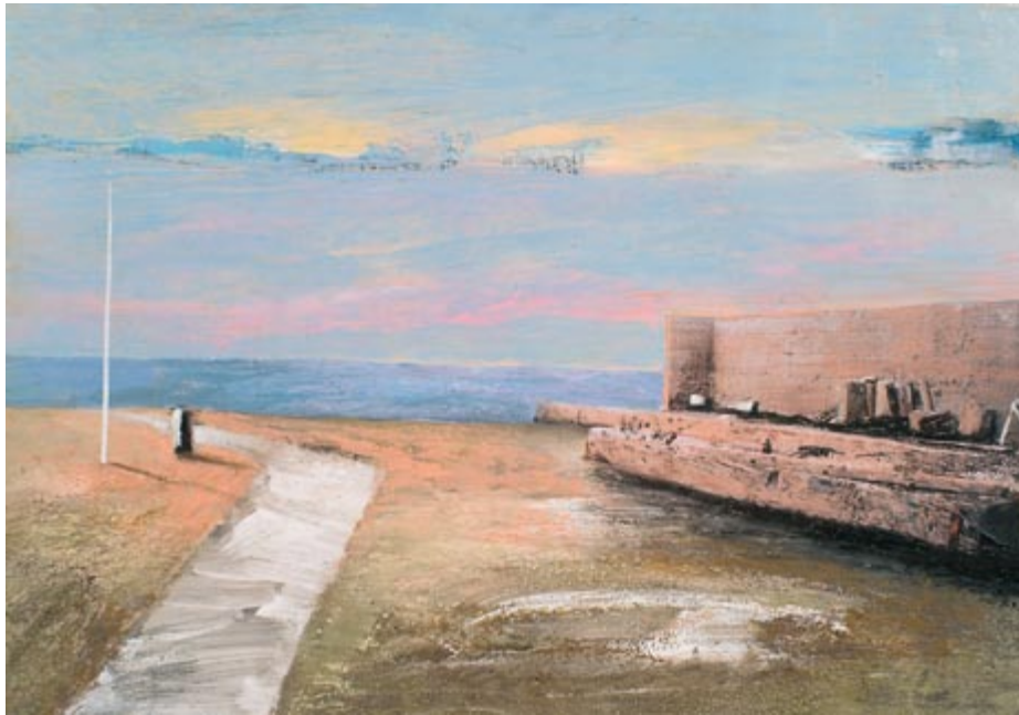
Murter III (kat. 13)