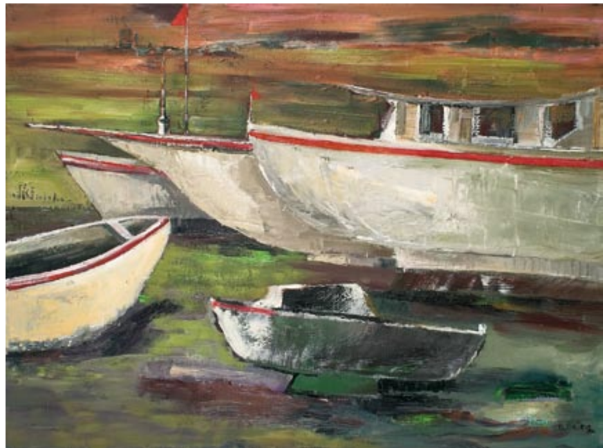
Murter III (kat. 39)