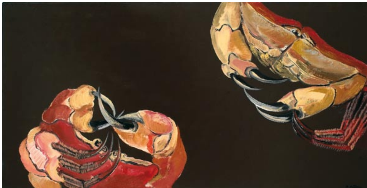
Owoce morza XI (kat. 26)