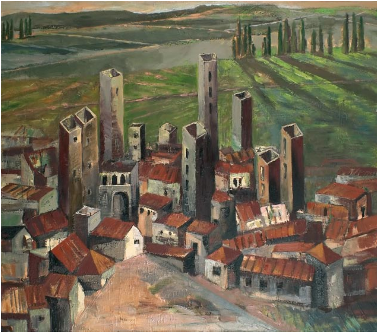
San Gimignano I (kat. 47)