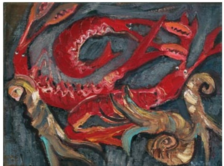
Owoce morza I (kat. 16)