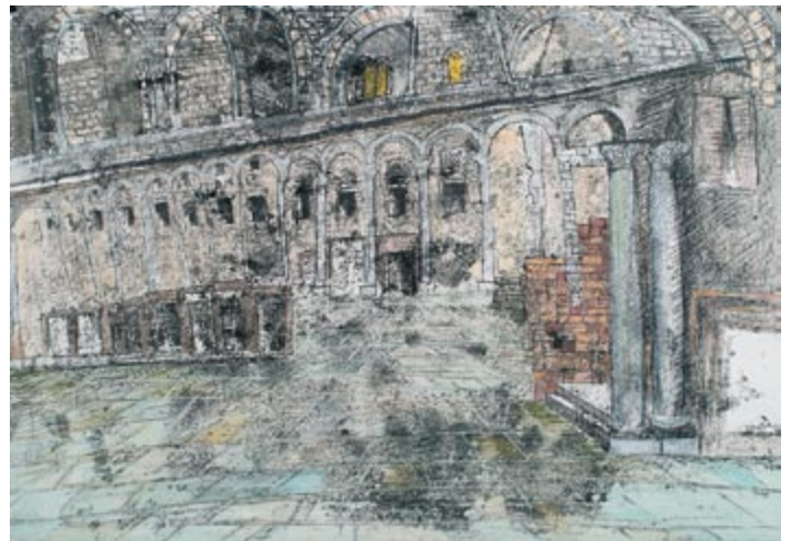
Droga I (kat. 45)