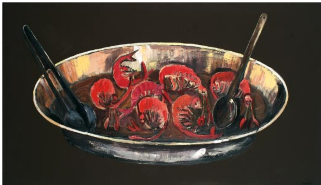
Owoce morza X (kat. 25)