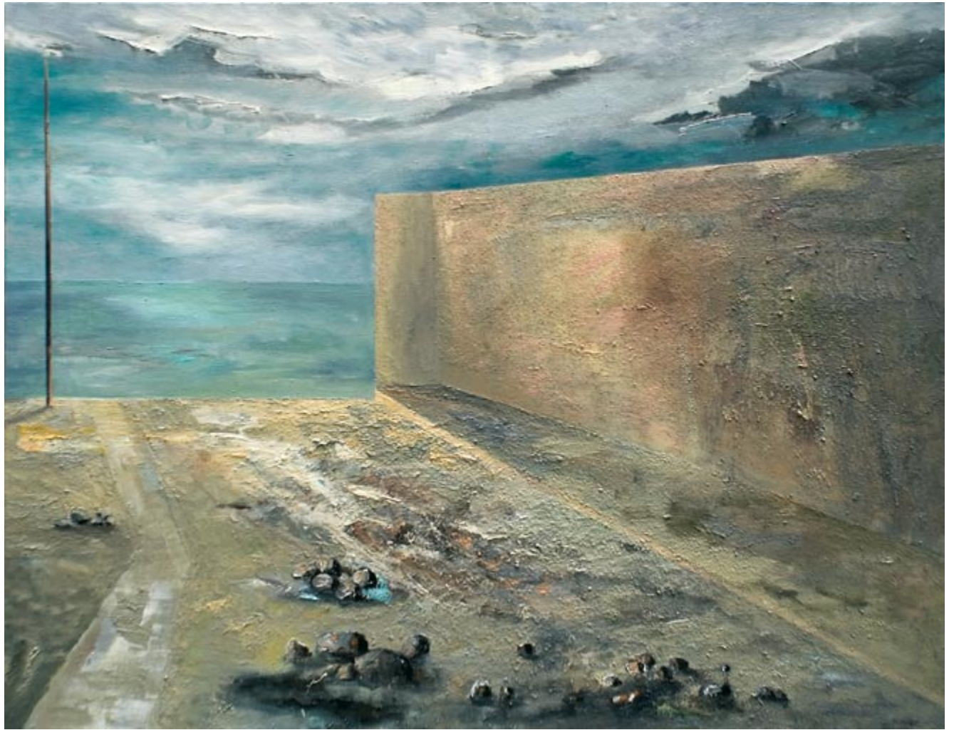
Murter V (kat. 37)