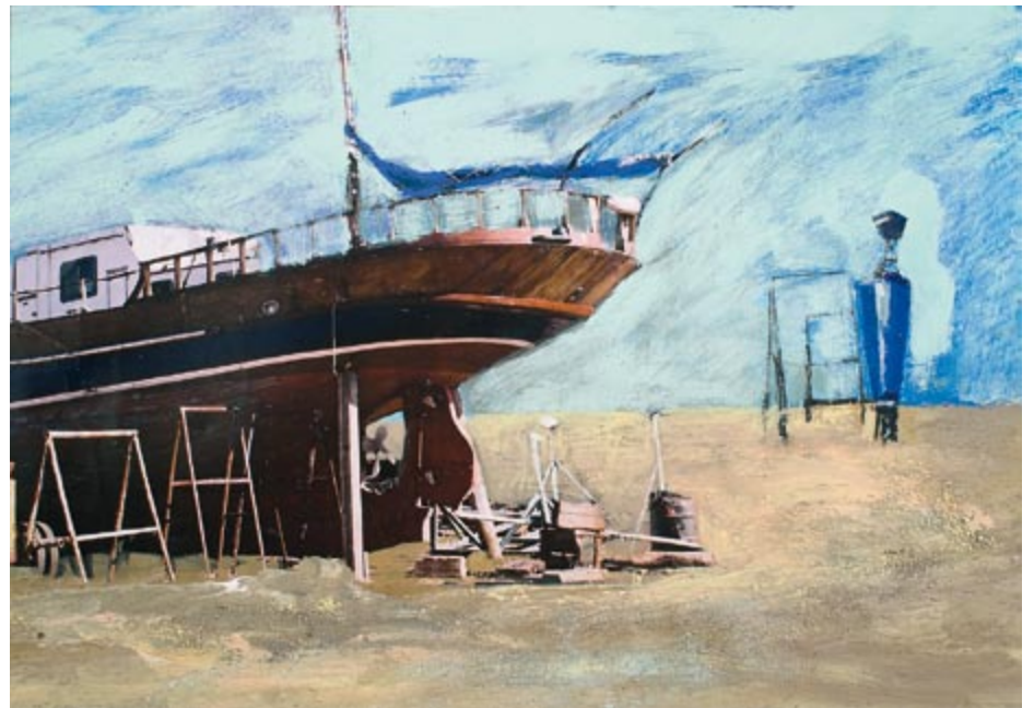
Murter IV (kat. 14)